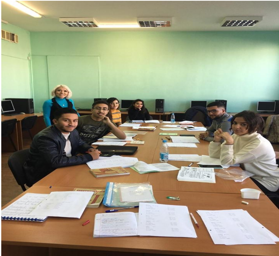
Séance de cours pour les étudiants de l'année préparatoire