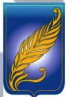
Université d'Etat de Biélorussie à Minsk